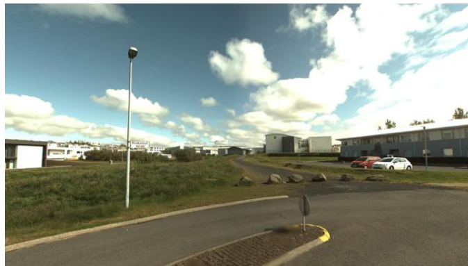
Aðkoma að framkvæmdasvæðinu frá Krókamýri