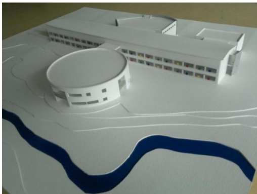
Líkan af Hofsstaðaskóla og hringlaga viðbyggingunni